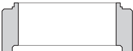
Kręgi zbiornika DN 1200 zakres wysokości: H = 250 mm H = 500 mm H = 750 mm H = 1000 mm